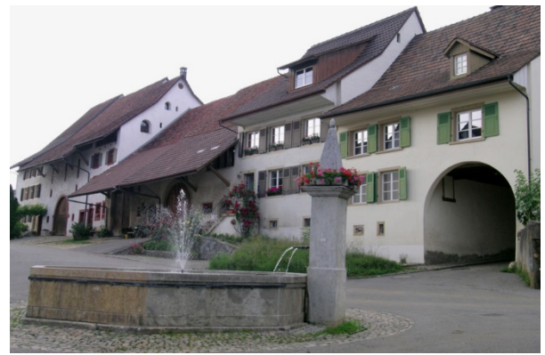
Dreisässenhäuser am Dorfplatz von Wenslingen