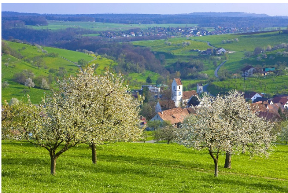
Hochstammbäume oberhalb von Oltingen