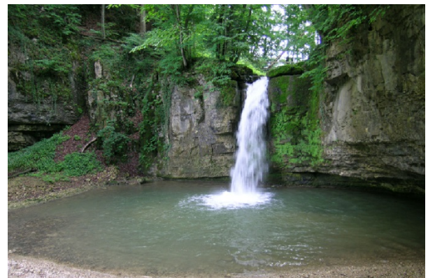
Schichtstufe mit «Giessen» im Eital