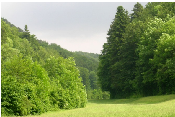
Sohlenkerbtal des Chrintelbachs